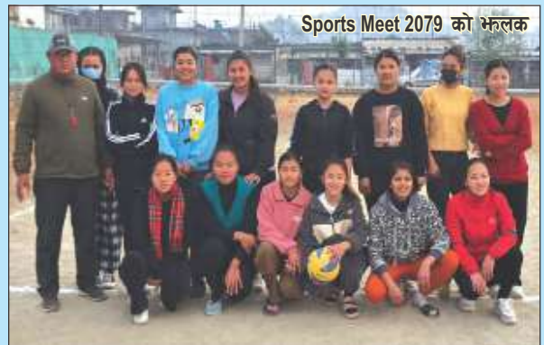
Sports Meet 2019 को भ्रमण