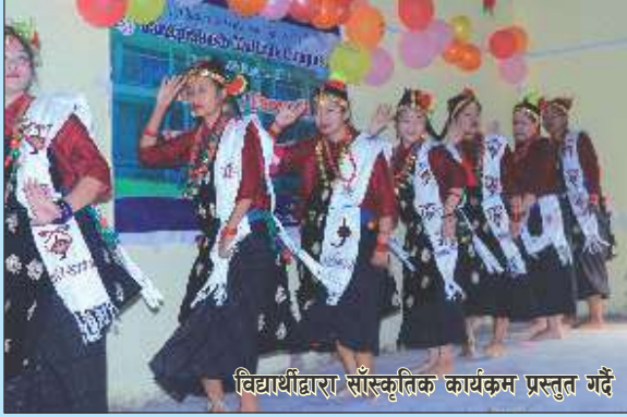
विद्यार्थीद्वारा साँस्कृतिक कार्यक्रम प्रस्तुत गर्दै