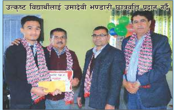
उत्कृष्ट विद्यार्थीलाई उमादेवी भण्डारी छात्रवृत्ति प्रदान गर्दै