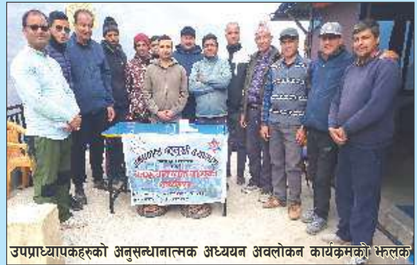
उपप्राध्यापकहरूको अनुसन्धानात्मक अध्ययन अवलोकन कार्यक्रमको भ्रमण