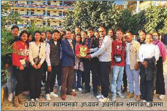
QAA प्राप्त क्याम्पसको अध्ययन अवलोकन भ्रमणका क्रममा