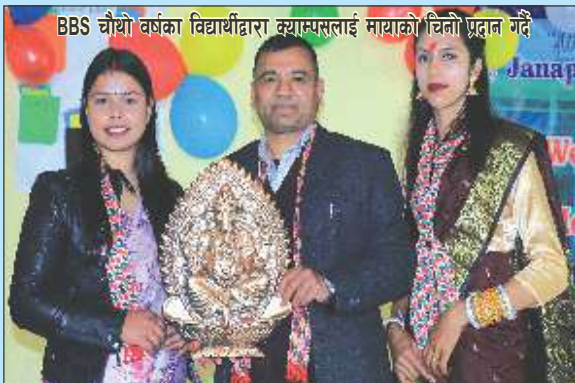
BBS चौथो वर्षका विद्यार्थीद्वारा क्याम्पसलाई मायाको चिनो प्रदान गर्दै