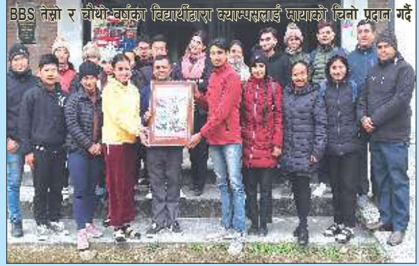
BBS तेस्रो र चौथो वर्षका विद्यार्थीद्वारा क्याम्पसलाई मायाको चिनो प्रदान गर्दै