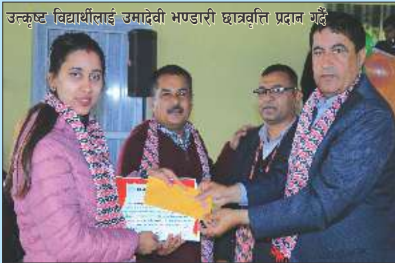
उत्कृष्ट विद्यार्थीलाई उमादेवी भण्डारी छात्रवृत्ति प्रदान गर्दै